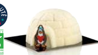
Le P'tit igloo