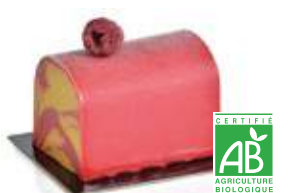
Framboise-mangue / passion bio