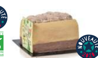
Le P'tit skieur caramel