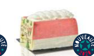
Le P'tit skieur fraise