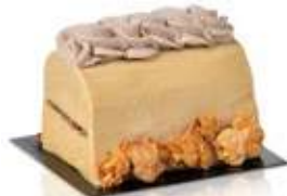
Caramel au beurre salé