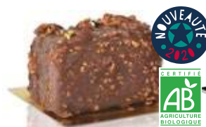
Chocolat éclats de chocolat bio